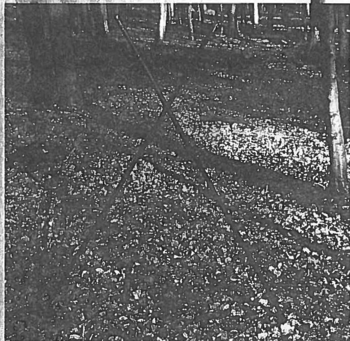
Zwei Balsastäbe und zwei Auspuffgummis – mehr braucht man für diesen Berg- und Zielstock nicht

Wenn Sie jetzt einen Auspuffring oben und einen Auspuffring unten anbringen, haben Sie