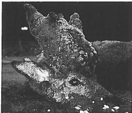
Solch eine Trophäe freut jeden Jäger. Doch oft ist die Präparation ein Problem. Wie das geht, lesen Sie im nebenstehenden Tipp

Abstand zwischen Auflage und Sitzbock 80 Zentimeter. Sitzbank und Brüstung sollte man verschrauben. Friedrich Priehs