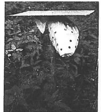
Menschenhaare schrecken das Wild ab und können so auch Kitzte vor dem Mähtod bewahren

Eine Plastiktüte normaler Größe durchlöchert man mit einer zehn bis 20 Millimeter runden Stanze und füllt sie dann mit Haaren. Auf einen Pfahl genagelt, mit einem zirka 50x50 Zentimeter großem Brett oder einer wasserfesten Platte darüber, bleiben die Haare trocken und duften deshalb viel länger. Der Duft verliert sich nicht, wenn man einmal in der Woche den Plastiksack durchknetet. Je nach Lage des Ackers und der Hauptwindrichtung stellt man zirka alle