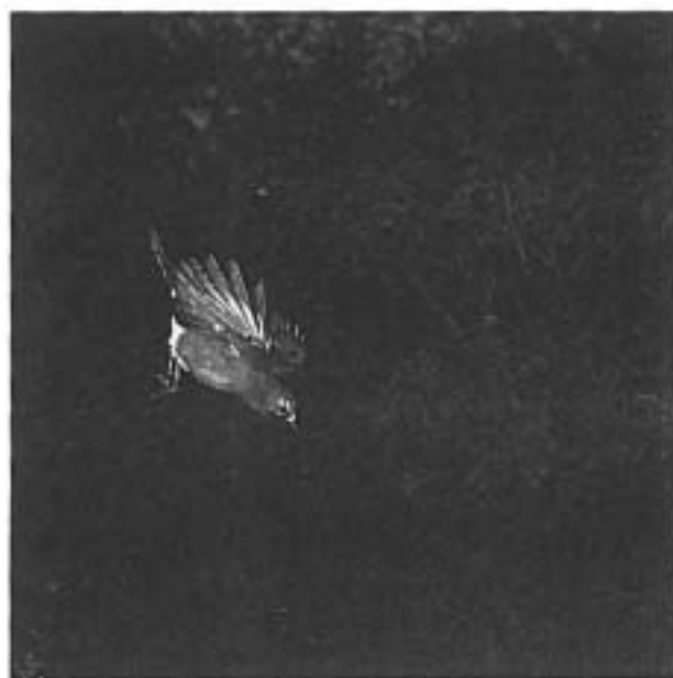
Eichelhäher im Fallflug.

Als der Eichelhäher durch die EG-Vogelschutzrichtlinien unter Naturschutz gestellt wurde, gab es seitens vieler Jäger Proteste. Geschürter Argwohn, scheinbarweise die Jagd abzuschießen, führte zu Unterschriftenaktionen, die den Ruf der Jäger in der Öffentlichkeit unreparierbar ruiniert haben. Denn natürlich ist die Frage gekommen,