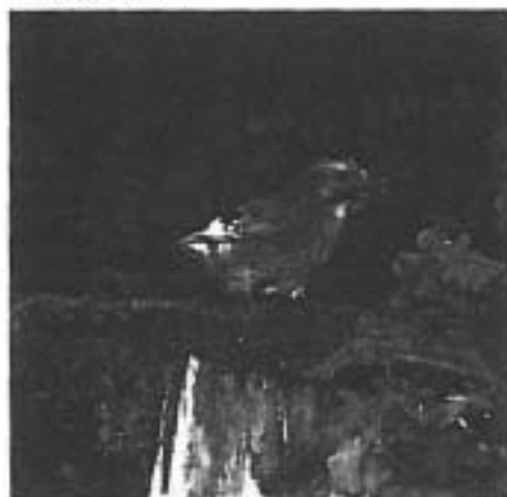
Eichelhäher mit Eichel.

Der Häher würgt natürlich schon, aber dort, wo er die Beute in der Erde verbergen will. In einer einzigen Vorratskammer hat man schon bis zu 4 kg Eichen gefunden. Meist aber werden die Früchte einzeln am Waldrand und auch in der Wiese versteckt. Er bevorzugt dabei offene, trockene bis mäßig feuchte Stellen, besonders solche, an denen sich der Schnee nicht lange hält, weil die Sonne den Boden wärmt. Mit ein paar Schnabelhieben schlägt er Löcher in den Boden und steckt eine Eichel hinein. Ersfaunlich dabei ist, daß er einen Teil der versteckten Eichen noch nach Monaten wiederfindet. Aber eben nur einen Teil, denn es bleiben genügend übrig, die in diesem von der Sonne erwärmten Waldboden keimen. So wachsen plötzlich Eichen an Plätzen, an die sie ohne durch die Saat der Häher nie hingekommen wären. Darum bezeichnet man den Eichelhäher seit alters her als Freund des Forstmanns und tatsächlich ist er ein außerordentlich nützlicher Vogel.