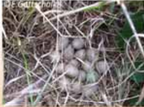
Nest (zeer moeilijk te vinden)